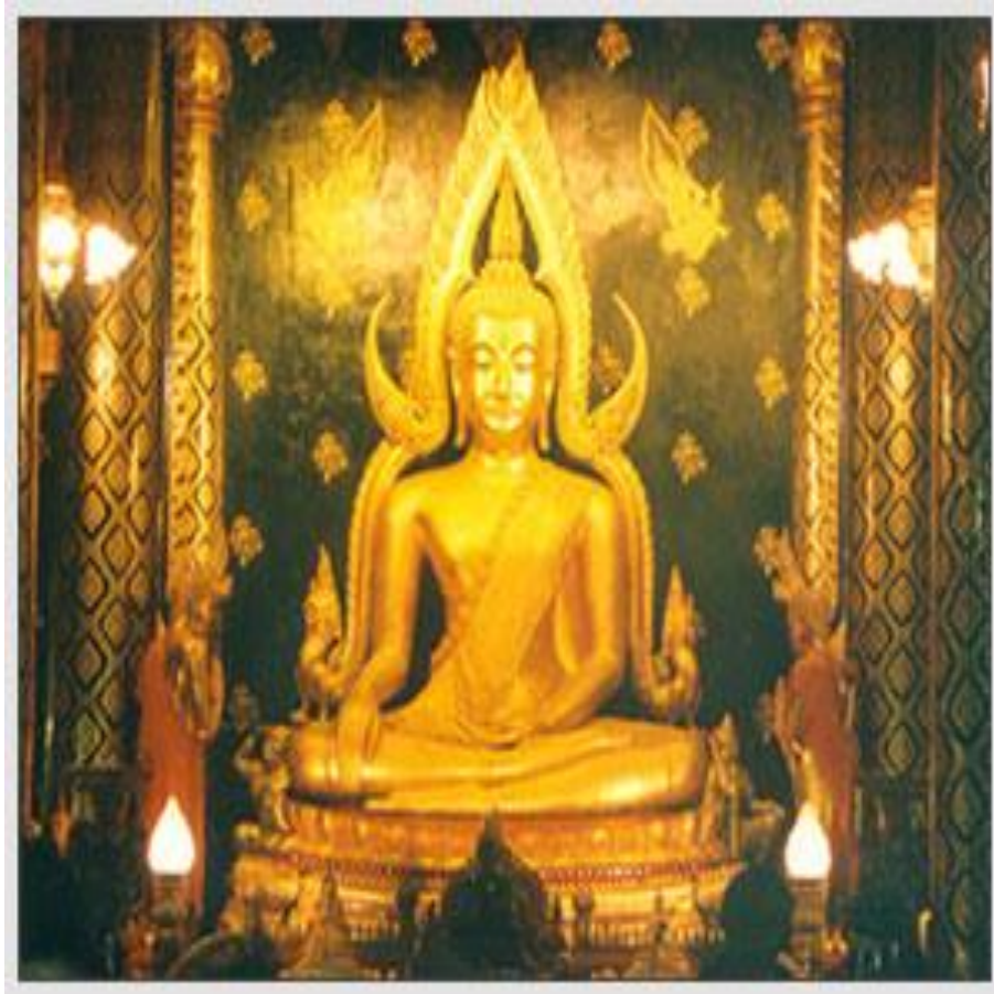
พระพุทธชินราช จังหวัดพิษณุโลก

อานิสงส์ของการสวดมนต์ บำบัดทุกข์ โศกโรคภัย รวมทั้งความรุ่มร้อนใจ ขจัดภัยอันตราย สิ่งชั่วร้ายที่จะพึงมี ปิดเป่าอุบาทว์ เสนียดจัญไร สิ่งอวมงคล ป้องกันภัยต่างๆ มีโจรภัย อัคคีภัย อสรพิษสัตว์ร้ายทั้งปวง ส่งเสริมให้เจริญด้วย อายุ วรรณะ สุขะ พละ ให้แคล้วคลาดภัย ประสบความสวัสดิ มีชัยเจริญงอกงามในชีวิต