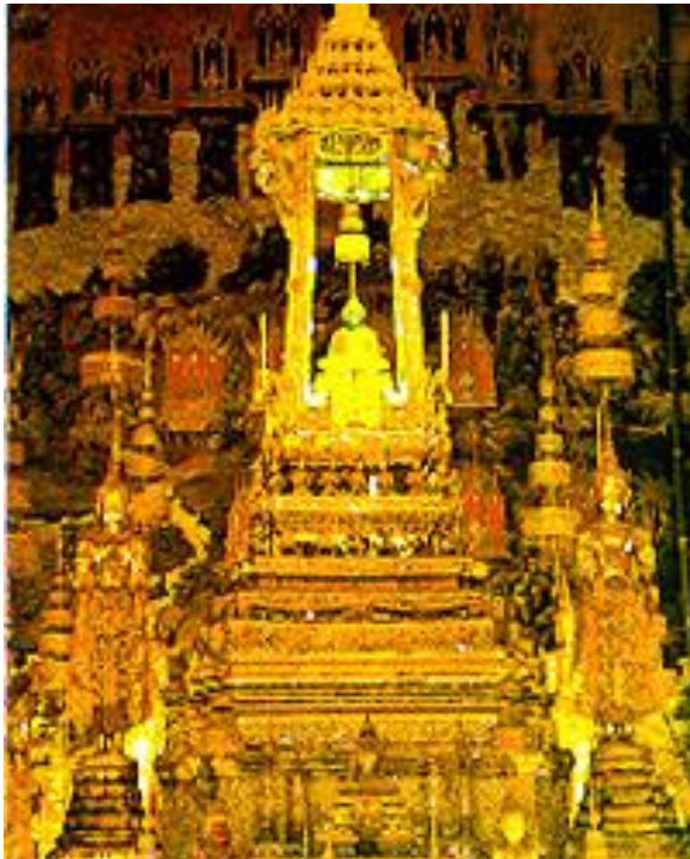
พระแก้วมรกต