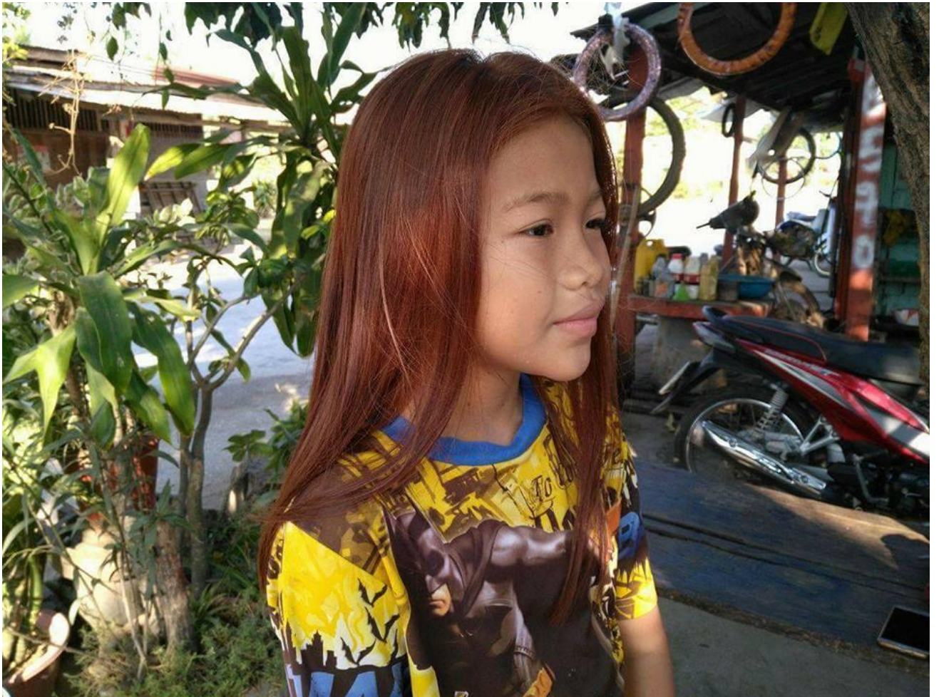
คนผมแดง อำเภอขานูร์ลักษบุรี