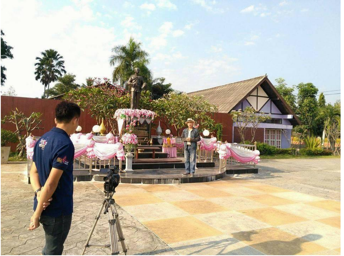
ที่ว่าการอำเภอเมืองขามเฒ่าลักษ์บุรี