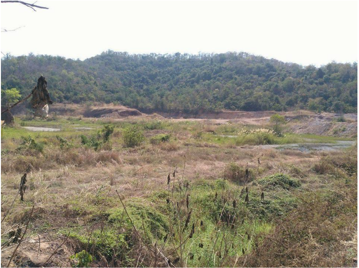
เขากะล่อน อำเภอขามเฒ่าสุพรรณบุรี