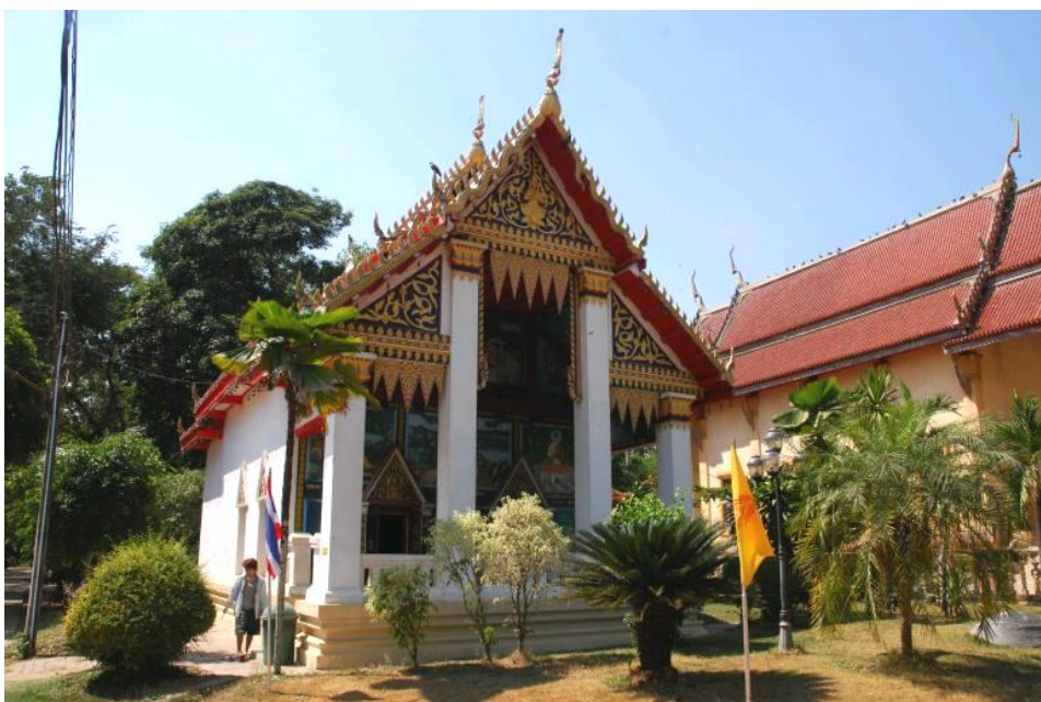
วัดสว่างอารมณ์ อ.ขานูวรลักษ์บุรี จ.กำแพงเพชร