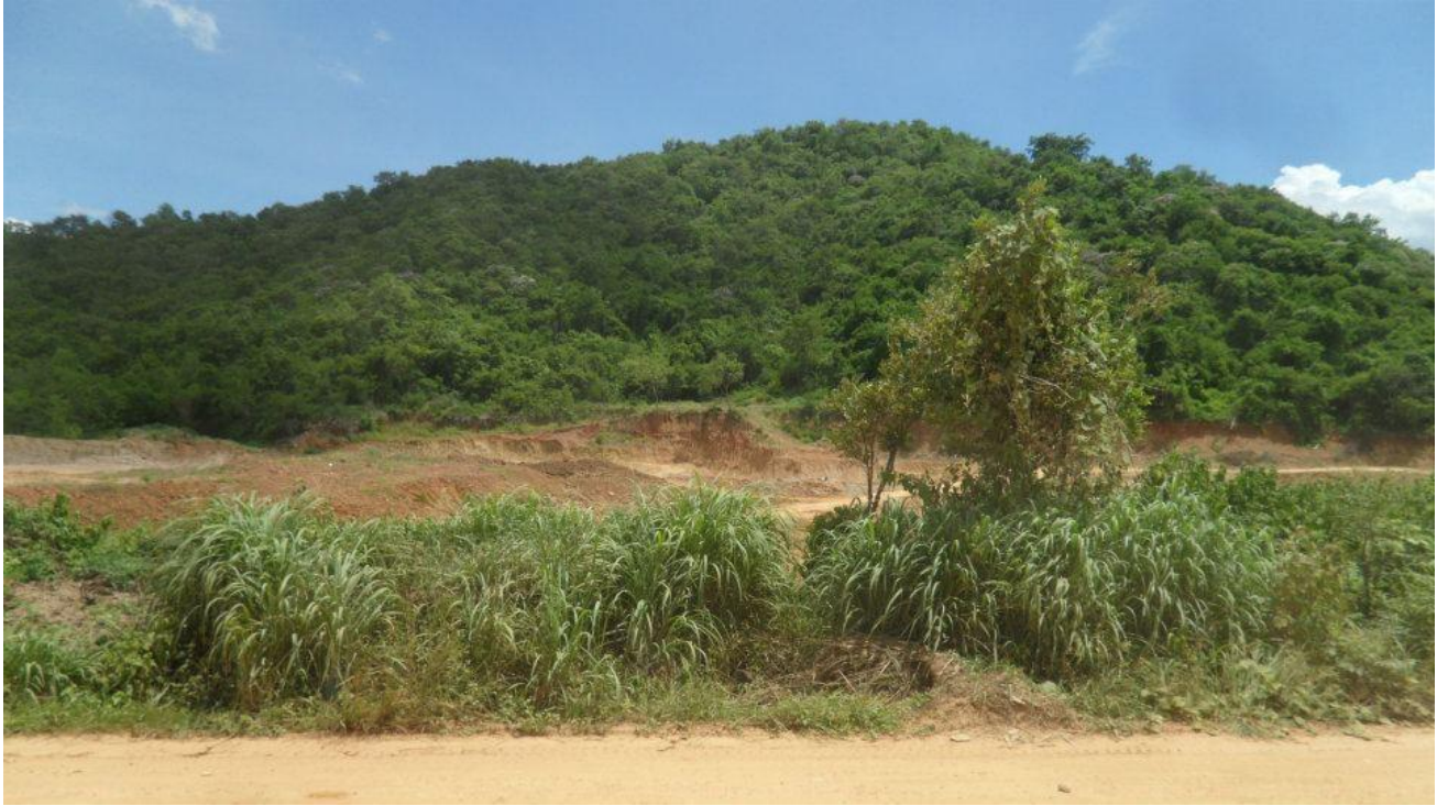
เขากะล่อน