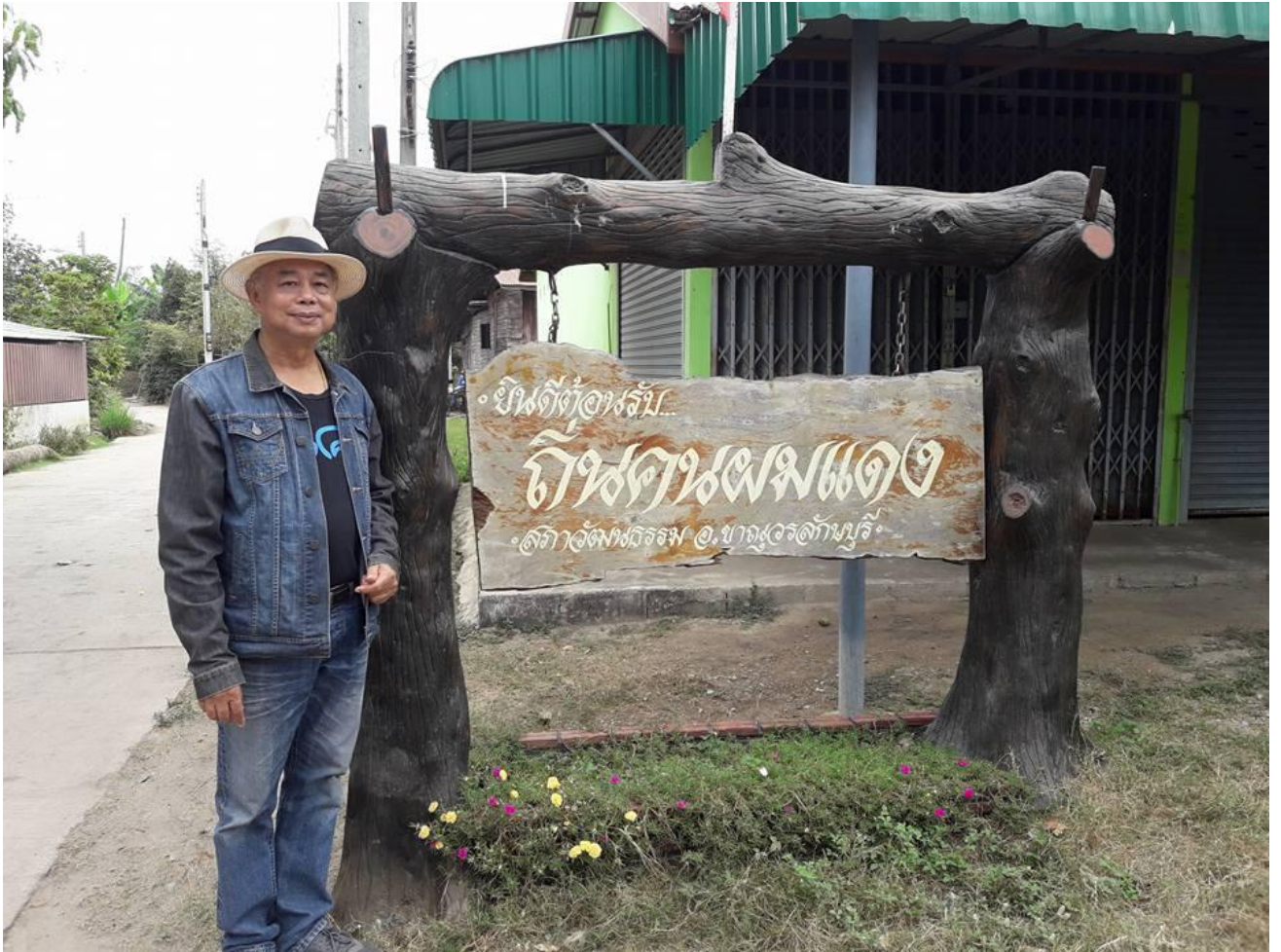
ถิ่นคนผมแดง อำเภอลำลูกเกดบุรี