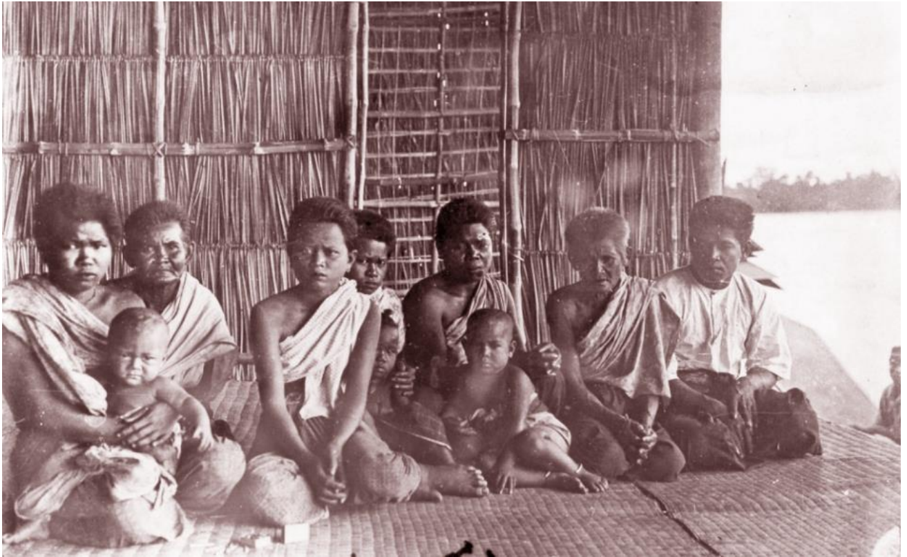
คนผมแดง อ.ชาณุวรลักษบุรี จ.กำแพงเพชร