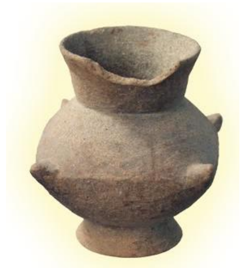
ภาชนะดินเผาจากเขากะล่อน ข้อมูลจาก มุลนิธิเล็ก-ประไพ วิริยะพันธุ์

เมื่อประมาณ หมื่นปี ที่ผ่านมามีขุนเขา เที้ยดยาว สามลูกต่อกัน ไกลลำนํ้า ปัง อันอุดมสมบูรณ์ไปด้วย นํ้าท่า ข้าวปลา สัตว์ป่า นานาชนิด มนุษย์ยุคหิน ของกำแพงเพชร ได้อาศัยอยู่ในถ้ำและเพิงผา เขากะล่อน ซึ่งเรียกขานกันต่อมา ว่าเขากะล่อน ปัจจุบัน อยู่ที่บ้านหาดชะอม ตำบลป่าพุทรา อำเภอขามเฒ่า ลําษบุรี จังหวัดกำแพงเพชร จากการค้นพบขวานหินขัด ขนาดต่างๆ รวมทั้งยัง ทำไม่สำเร็จหลายร้อยอัน หัวธนูหิน กำไลหิน ที่ติดอยู่กับกระดูกท่อนแขน สันนิษฐานว่า น่าจะมีประชากรยุคหินกำแพงเพชร อาศัยอยู่ในถ้ำเขากะล่อน หลายครอบครัว ปัจจุบันเขากะล่อน ยังถูกทิ้งร้าง ยังไม่ได้มีการค้นคว้าและ ศึกษาอย่างจริงจัง น่าเสียดายว่าหลักฐานสำคัญต่างๆ จะมลายไปสิ้น เมืองแสนตอ เป็นเมืองที่นำมาเยือนอีกเมืองหนึ่ง เดินทางท่องเที่ยวตามคำ ขวัญประจำอำเภอ ก็คุ้มแล้วเมืองตอเป็นแสน ดินแดนประพาสต้น ถิ่นคนผม แดง แหล่งอารยธรรมโบราณ