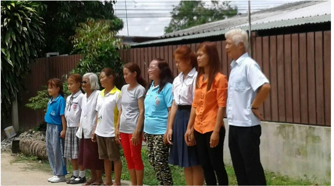
หมู่บ้านคนผมแดง