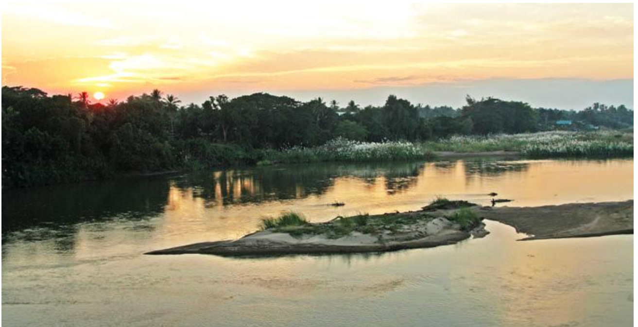
ลุ่มแม่น้ำปิง ทาดใต้แสนตอ

เมืองแสนตอเป็นชื่อเดิมของ อำเภอชาณุวรลักษบุรี ตั้งอยู่บริเวณทางใต้ลุ่มแม่น้ำปิง เป็นชุมชนโบราณเรียกว่า เมืองแสนตอ สันนิษฐานว่าเป็นเมืองโบราณรุ่นเดียวกับเมืองเทพนคร เมืองไตรตรึงษ์ เมืองพาน เมืองคนที เมืองนครชุม เมืองซำกักราว มีประวัติความเป็นมาที่ยาวนานในสมัยสมเด็จพระมหาจักรพรรดิ แห่งกรุงศรีอยุธยา มีบันทึกใน พงศาวดารฉบับหลวงประเสริฐ ว่าพ.ศ. ๒๑๐๒ สมเด็จพระมหาจักรพรรดิเสด็จมาคล้องช้าง ณ เมืองแสนตอ ซึ่งขึ้นกับ เมืองกำแพงเพชร ได้ช้าง ๔๐ เชือก