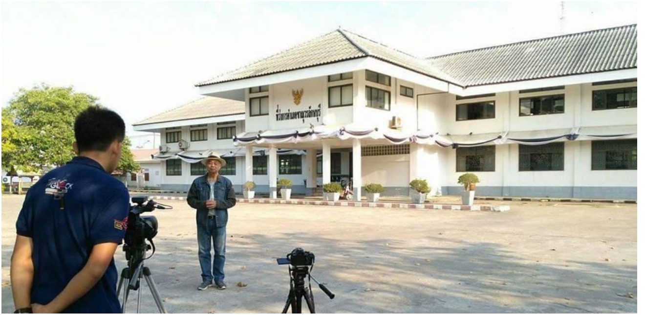
ที่ว่าการอำเภอเมืองขามเฒ่าบุรี