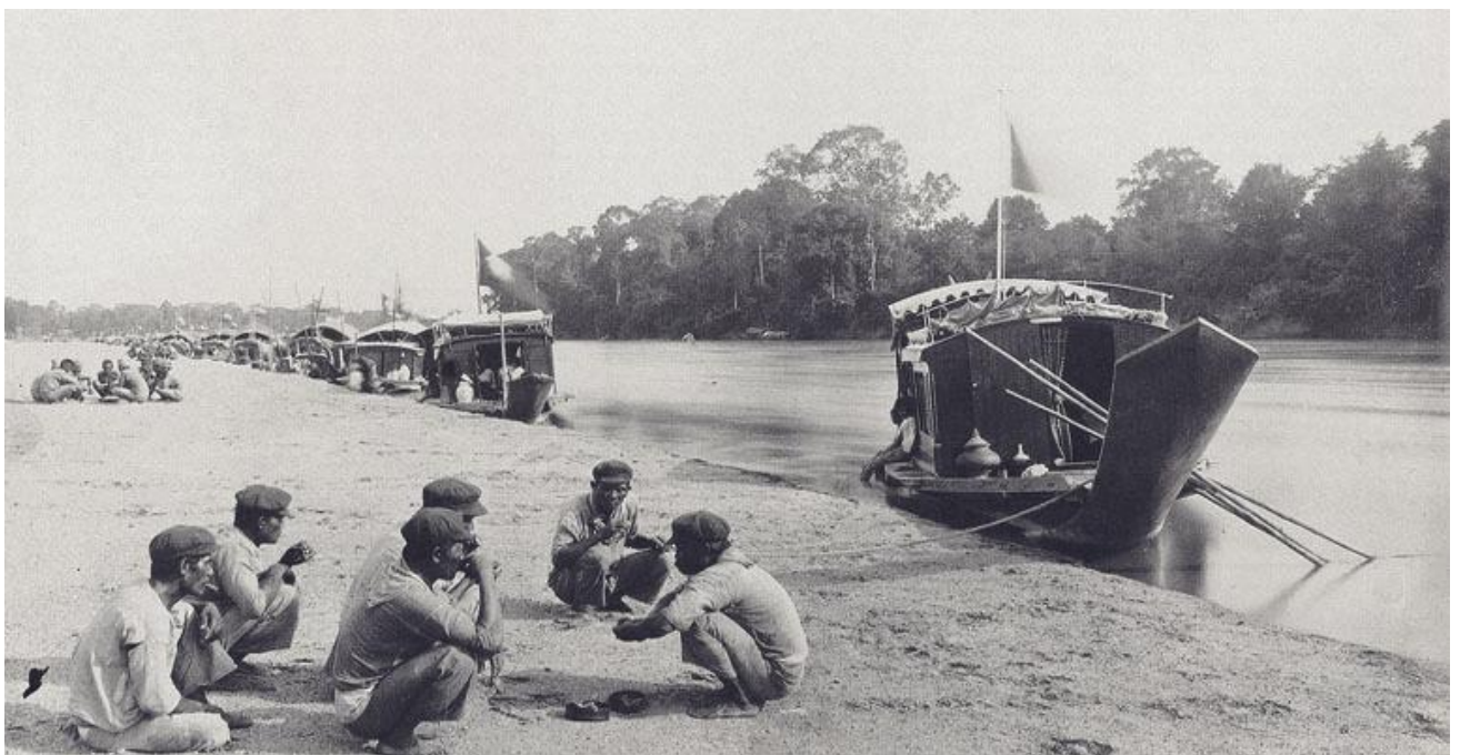
เรือพระที่นั่งและผู้ตามเสด็จฯ หาดใต้แสนตอ กำแพงเพชร

ในเดือนสิงหาคม ปีพระพุทธศักราช ๒๔๔๙ พระพุทธเจ้าหลวงได้เสด็จประพาสต้นหัวเมืองเหนือ เพื่อได้ทรงทอดพระเนตร ความเป็นอยู่ของอาณาประชาราษฎร์ด้วยพระเนตรของพระองค์ พระบารมีปกเกล้าชาวแสนตอ ในวันที่ ๑๘ สิงหาคม ๒๔๔๙ พระองค์ทรงบันทึกจดหมายเหตุไว้ว่า จนเวลาย่ำค่ำขึ้นที่หาดบ้านแสนตอ เดินข้ามไปวัดสว่างอารมณ์ ตำบลที่เรียกว่าแสนตอ จนเป็นชื่อเมืองขานู นี้มีตอมากจริง เรือได้โดนครั้งหนึ่ง เพราะเหตุที่เป็นตลิ่งพังมาก เดินตามถนนฝั่งตะวันตก แวะเก็บอะไรต่ออะไรบ้าง มาจนถึงวัดซึ่งเป็นวัดสร้างใหม่ เรียกว่าวัดหัวเมือง ต่อแต่วัดนั้นมาถึงที่ว่าการเมือง ซึ่งยังเป็นหลังคามุงแฝกอยู่ทั้งนั้น ที่จอดเรืออยู่เหนือที่ว่าการนิดหนึ่ง พระองค์ทรงประทับแรม ณ ที่นี้ หนึ่งราตรี ชาวแสนตอ มีความภาคภูมิใจมากกว่า ครั้งหนึ่งพระมหากษัตริย์ผู้ยิ่งใหญ่ ได้เสด็จพระราชดำเนินจากวัดสว่างอารมณ์ถึงที่ว่าการเมืองแสนตอ ชาวแสนตอยังประทับใจอยู่มีรูปลิ่ม