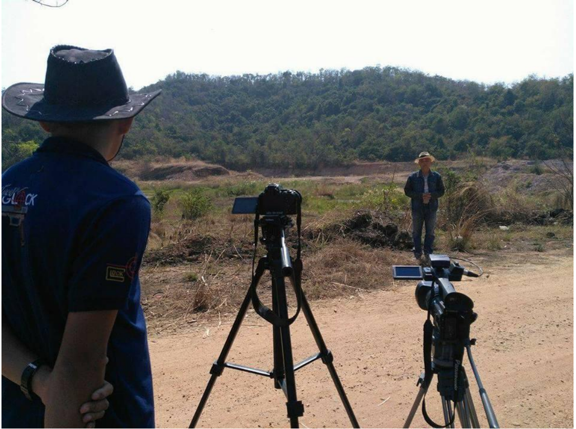
เขากะล่อน อำเภอลำลูกเกดบุรี