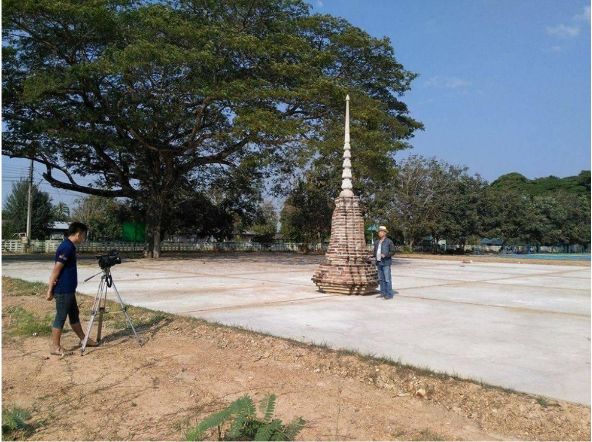
อำเภอขามเฒ่าบุรี