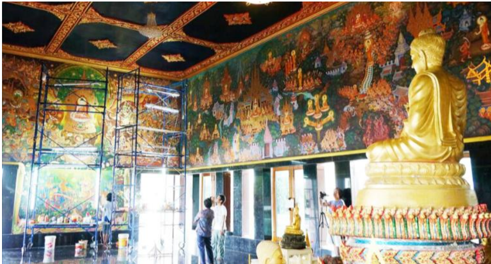
จิตรกรรมฝาผนัง วัดป่าไทรงาม

รอบวัดมีลักษณะเป็นวัดป่าที่กำลังพัฒนาให้เป็นป่าท่ามกลางท้องนา รอบๆศาลาอเนกประสงค์ มีสระบัวล้อมรอบ สะพานไม้ เราเข้าไปชมพระอุโบสถที่กำลังก่อสร้าง ที่แปลกกว่าอุโบสถโดยทั่วไปคือมีสองชั้น ชั้นล่างจะใช้สำหรับนั่งวิปัสสนากรรมฐาน ภาพจิตรกรรมฝาผนังที่สอนให้คนเกรงกลัวบาป ท่ามกลางสังคมที่สับสนเป็นการฝ่ากระแสแห่งการเปลี่ยนแปลงของสังคม ไปอย่างกล้าหาญ