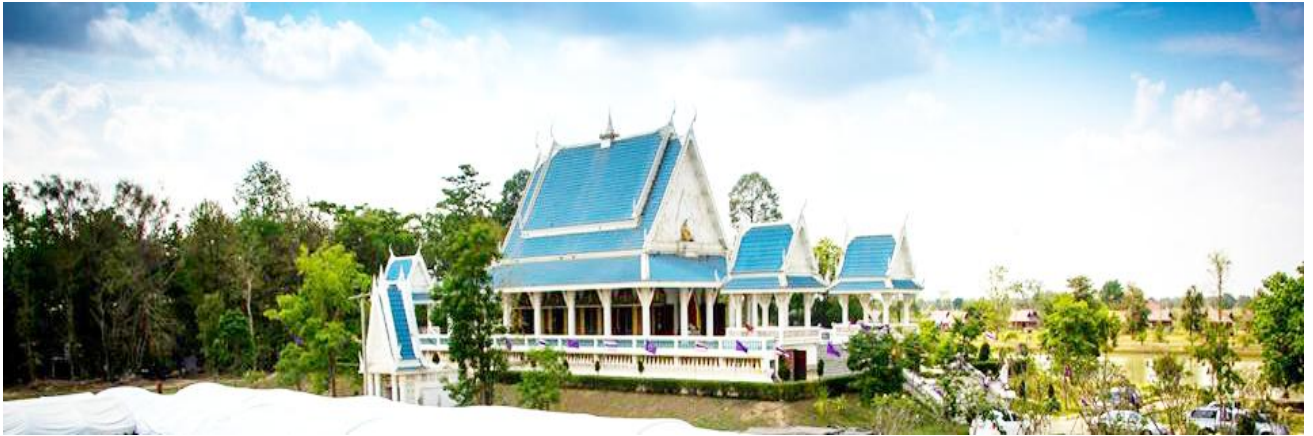
วัดป่าไทรงาม