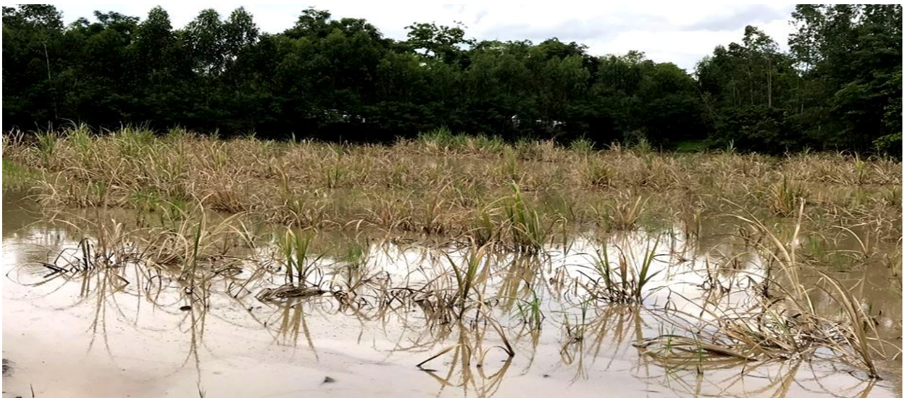
ภัยธรรมชาติ น้ำท่วมพื้นที่เกษตร อำเภอไทรงาม