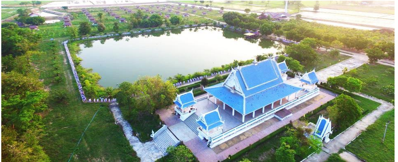
พื้นที่โดยรอบวัดป่าไทรงาม

รอบวัดมีลักษณะเป็นวัดป่าที่กำลังพัฒนาให้เป็นป่าท่ามกลางท้องนา รอบๆศาลาอเนกประสงค์ มีสระบัวล้อมรอบ สะพานไม้ เราเข้าไปชมพระอุโบสถที่กำลังก่อสร้าง ที่แปลกกว่าอุโบสถโดยทั่วไปคือมีสองชั้น ชั้นล่างจะใช้สำหรับนั่งวิปัสสนากรรมฐาน ภาพจิตรกรรมฝาผนังที่สอนให้คนเกรงกลัวบาป ท่ามกลางสังคมที่สับสนเป็นการฝ่ากระแสแห่งการเปลี่ยนแปลงของสังคม ไปอย่างกล้าหาญ