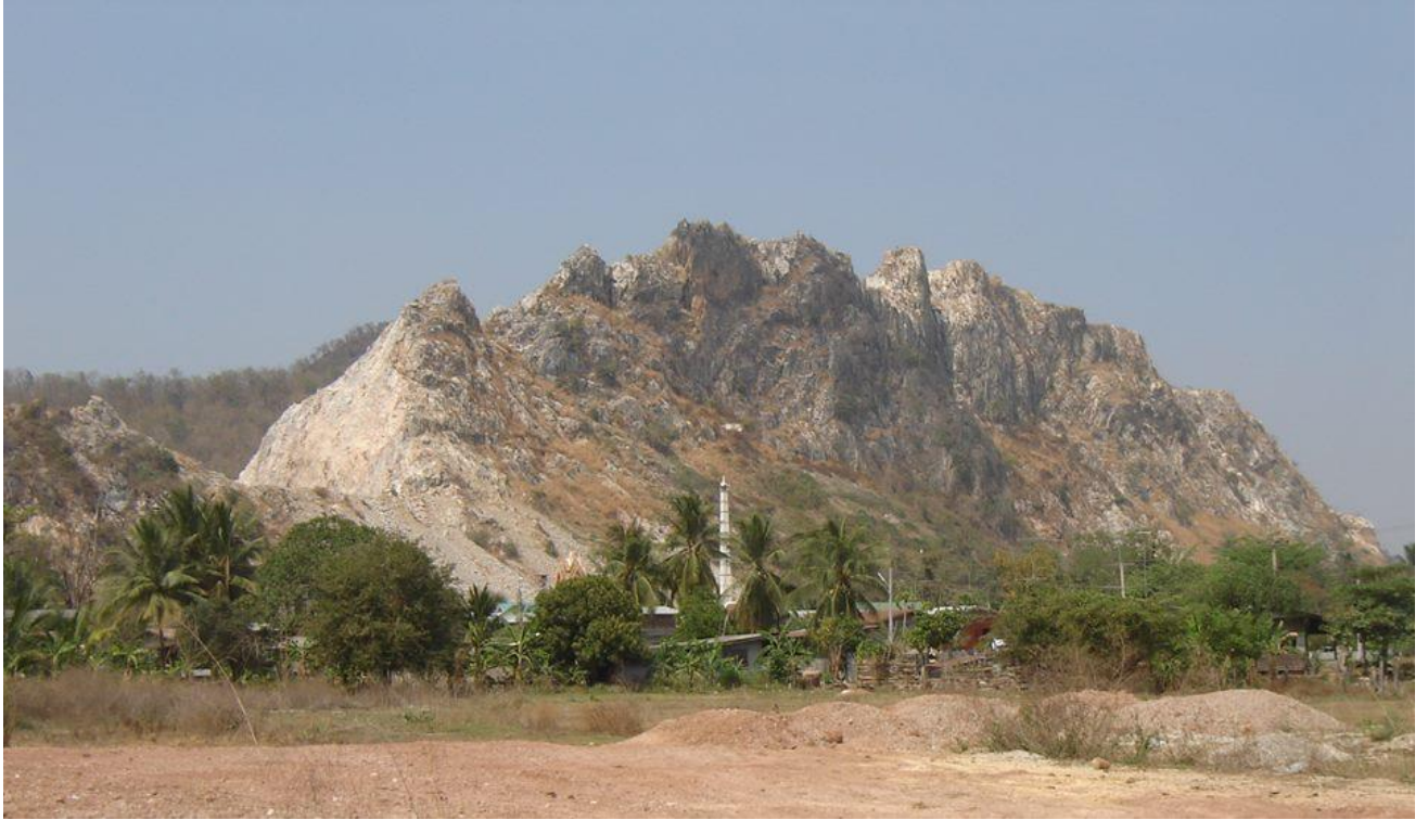
ทิวเขาแหล่งหินอ่อน พรานกระต่าย