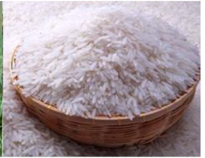
ข้าวสาร -> ข้าวส่าน