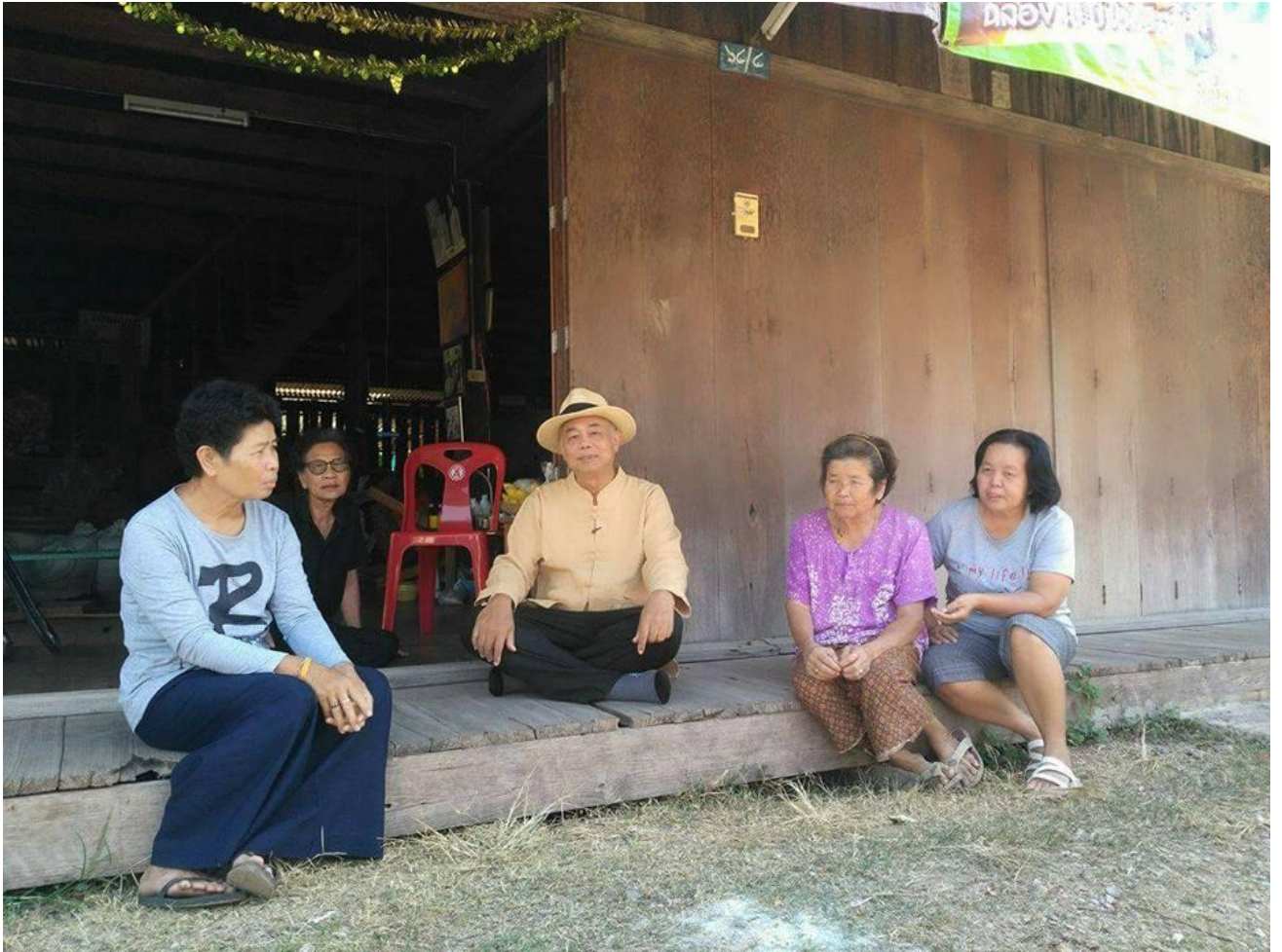
สัมภาษณ์ภาษาถิ่น ชาวพราวนกระต่าย