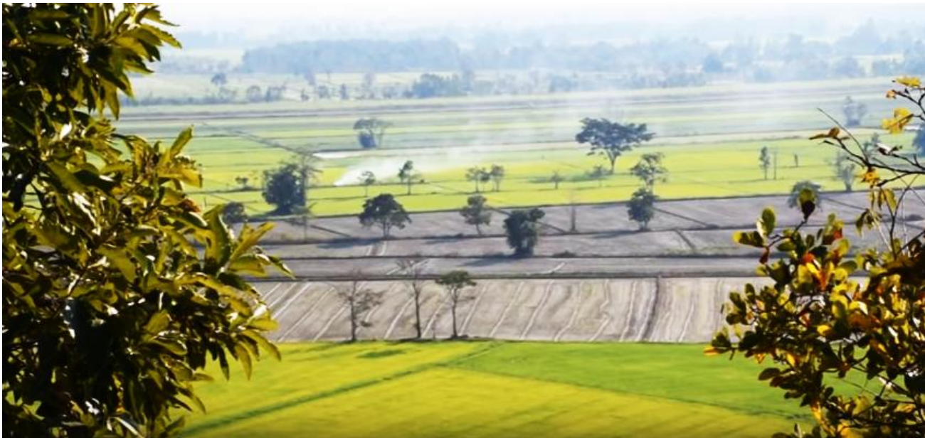
เมืองบางพาน อำเภอรานกระต่าย