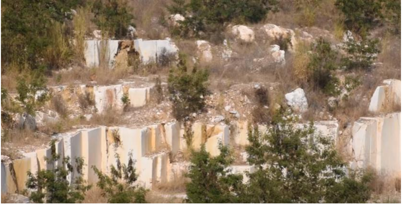
เขาเหล็ก