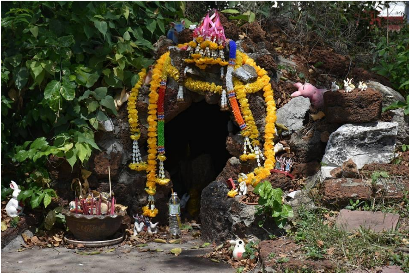
ศาลเจ้าพ่อกระต่ายทอง