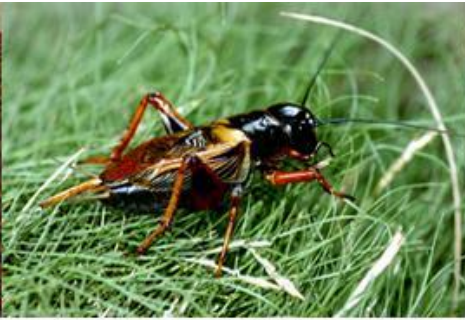
จิ้งหรีด -> อีหนิด