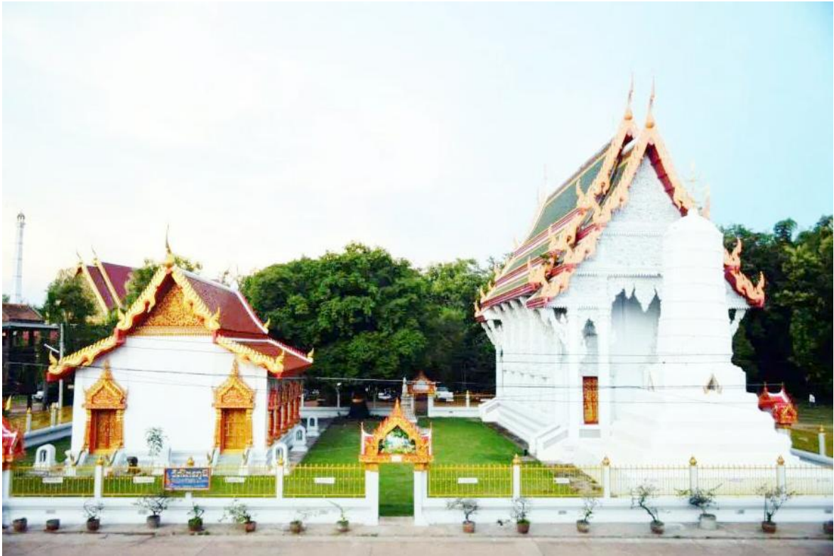
วัดไตรภูมิ ตำบลถ้ำกระต่ายทอง

อำเภอพานกระต่าย ยังมีวัดที่เก่าแก่ และทรงคุณค่าทางประวัติศาสตร์ วัฒนธรรมและ โบราณคดี จำนวนมาก อาทิวัด