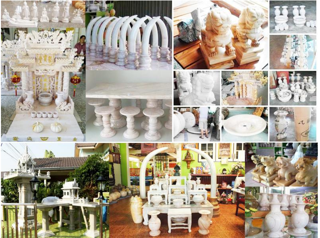
ผลิตภัณฑ์หินอ่อน อำเภอพรานกระต่าย

การผลิตหินอ่อนที่อำเภอพรานกระต่าย จังหวัดกำแพงเพชร จึงเป็นอาชีพเด่นที่สุดอาชีพหนึ่งของจังหวัดกำแพงเพชร ที่นำรายได้มาสู่จังหวัด จำนวนมากหินอ่อนของพรานกระต่าย มีมาตรฐานการผลิต ที่พัฒนาแล้ว ทัดเทียมหรือบางอย่างอาจล้ำหน้าต่างชาติ ผลิตภัณฑ์หินอ่อนที่มีชื่อเสียงของอำเภอพรานกระต่าย จัดเป็นสินค้าของชุมชน อาทิ ช้างแกะสลัก โคมไฟ ที่ทับกระดาศ บัตรพระ แจกัน ศาลเจ้า นาฬิกาตั้งโต๊ะ โต๊ะ แก้ว อี จานแก้ว ถังแช่ไวน์ และของแต่งบ้านจำนวนมาก มีความละเอียดอ่อนที่สวยงาม ทำชื่อเสียงและรายได้มาสู่จังหวัดกำแพงเพชร จำนวนมาก