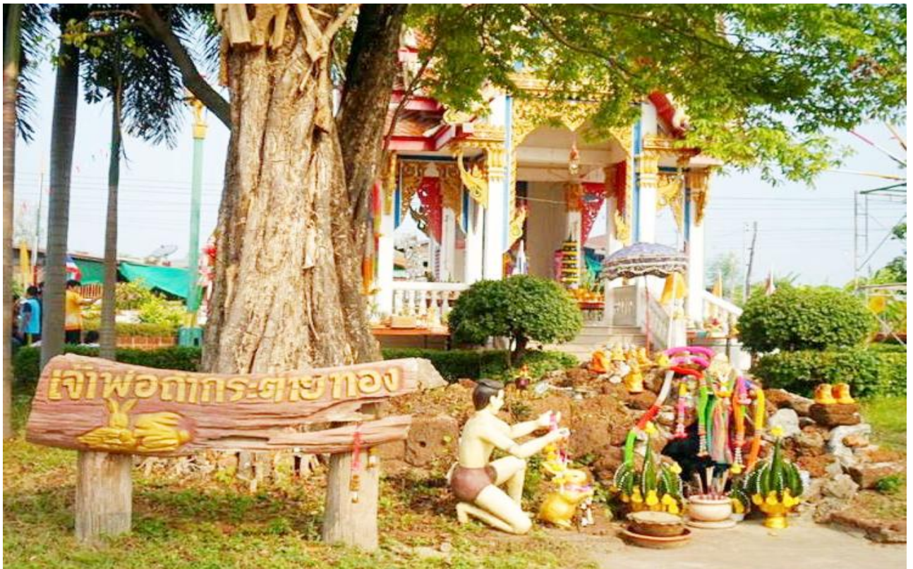
ศาลเจ้าพ่อถ้ำกระต่ายทอง

ตัวสำคัญ ณ บริเวณที่เดิมที่พบกระต่ายได้ใช้ความพยายามดักจับหลายครั้ง แต่กระต่ายตัวนั้นสามารถหลบหนีไปได้ทุกครั้ง นายพรานมีความมุมานะที่จะจับให้ได้จึงไปชวนเพื่อนฝูงนายพรานด้วยกันมาช่วยกันจับ แต่ยังไม่ได้จึงอพยพลูกหลานพี่น้อง และกลุ่มเพื่อนฝูงต่าง มาสร้างบ้านถาวรขึ้นเพื่อผลที่จะจับกระต่ายชนสีทองให้ได้ กระต่ายก็หลบหนีเข้าไปในถ้ำซึ่งหน้าถ้ำมีขนาดเล็กนายพรานเข้าไปไม่ได้แม้พยายามหาทางเข้าเท่าไรก็ไม่พบจึงได้ตั้งหมู่บ้านขึ้นหน้าถ้ำเพื่อเฝ้าคอยจับกระต่ายชนสีทอง ตั้งแต่บัดนั้นเป็นต้นมา ซึ่งต่อมาหมู่บ้านได้ขยายตัวเป็นชุมชนขนาดใหญ่จึงได้เรียกชุมชนนั้นว่า “บ้านพรานกระต่าย” และเป็นชื่ออำเภอพรานกระต่าย ในสมัยต่อมา