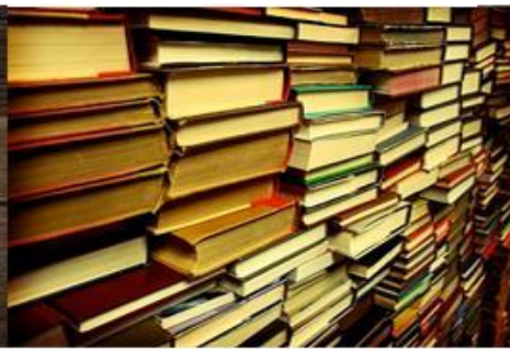
หนังสือ -> หนังสือ