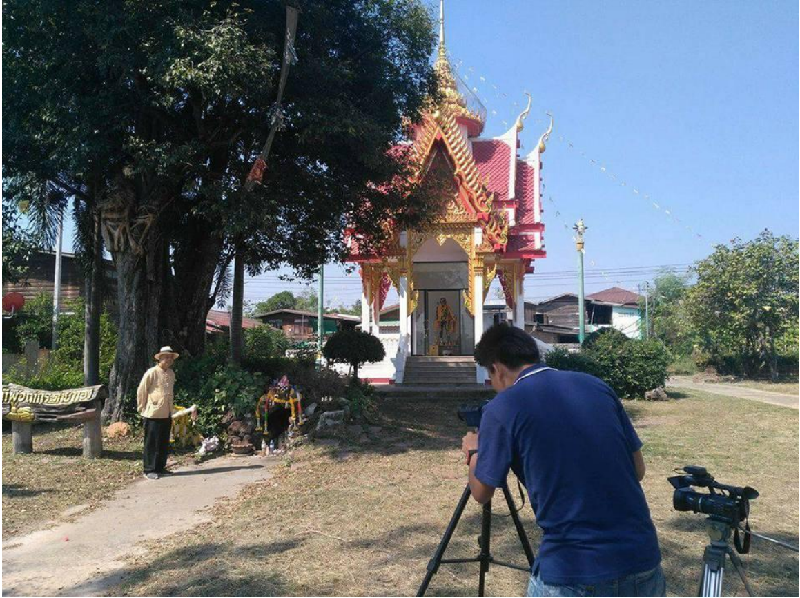
ศาลเจ้าพ่อกระต่ายทอง