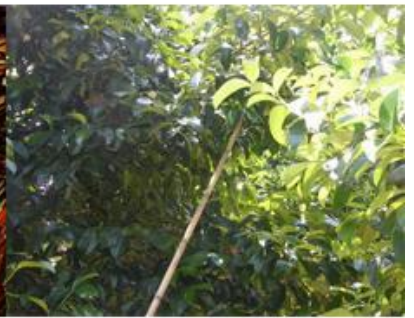
ไม้สอยผลไม้ -> ไม้เสา