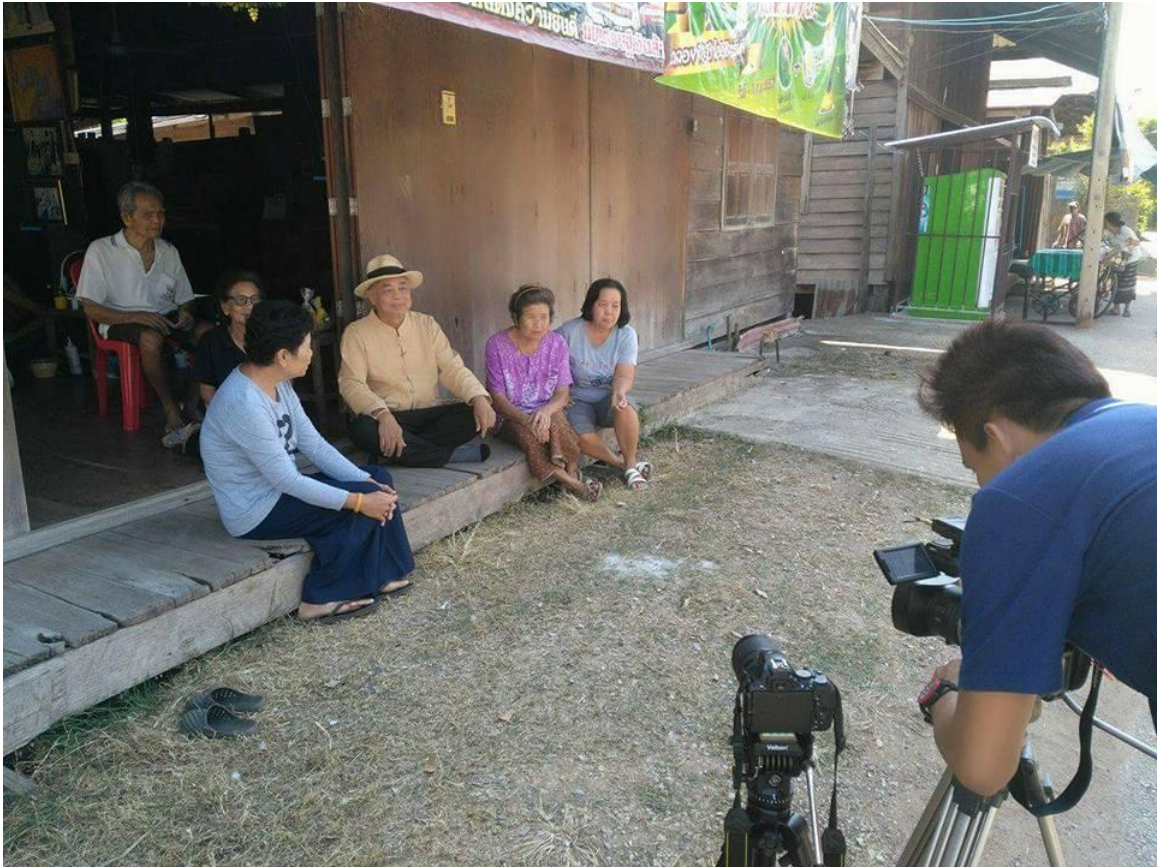
เอกลักษณ์ภาษาถิ่น ถ่ายทำสารคดีชุด อำเภอพรานกระต่าย ภาษาเป็นเอกลักษณ์ที่ยอดเยี่ยม