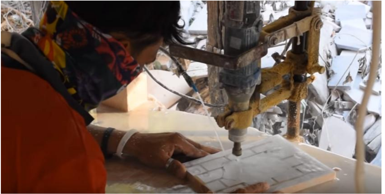
การทำผลิตภัณฑ์จากหินอ่อน