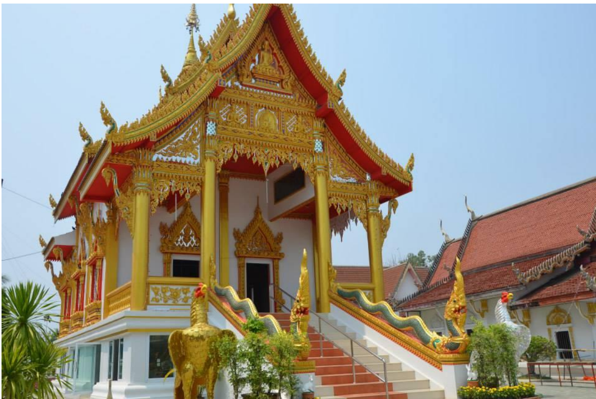
วัดอินทาราม ตำบลท่าไม้