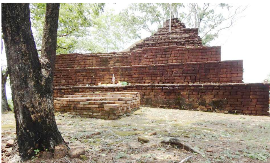
โบราณสถานเขานางทอง ตำบลเขาศิรีส

เมืองบางพาน อยู่ที่บ้านวังพาน ตำบลเขาศิรีส อำเภอรานกระต่าย เป็นชุมชนโบราณที่ตั้งอยู่บนเส้นทางถนนพระร่วงที่จะไปยังสุโขทัย มีลักษณะเมืองค่อนข้างกลม มีคูน้ำและคันดินล้อมรอบสามชั้น ภายในเมืองพบซากโบราณสถานขนาดเล็ก มีสภาพเป็นกองศิลาแลง ด้านตะวันตกเฉียงเหนือของเมืองมี เขานางทอง บนยอดเขามีโบราณและฐานพระเจดีย์ทรงดอกบัวตูม ภายในเมืองพานแม้ว่าจะพบซากโบราณสถานขนาดเล็ก เมื่อเปรียบเทียบกับขนาดของผังเมือง แต่ความสำคัญของชุมชนแห่งนี้คือ เป็นเมืองที่อยู่บนเส้นทางคมนาคม ที่ติดต่อกับกรุงสุโขทัย และเมืองอื่นได้สะดวก เป็นเมืองที่ตั้งอยู่ท่ามกลางที่ราบลุ่มซึ่งเพาะปลูกได้ดี เคยเป็นที่ประดิษฐานรอยพระพุทธรบาท ที่พญาลิไท นำมาประดิษฐานไว้