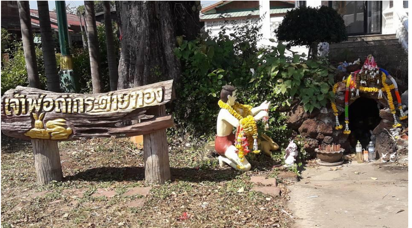
ศาลเจ้าพ่อกระต่ายทอง