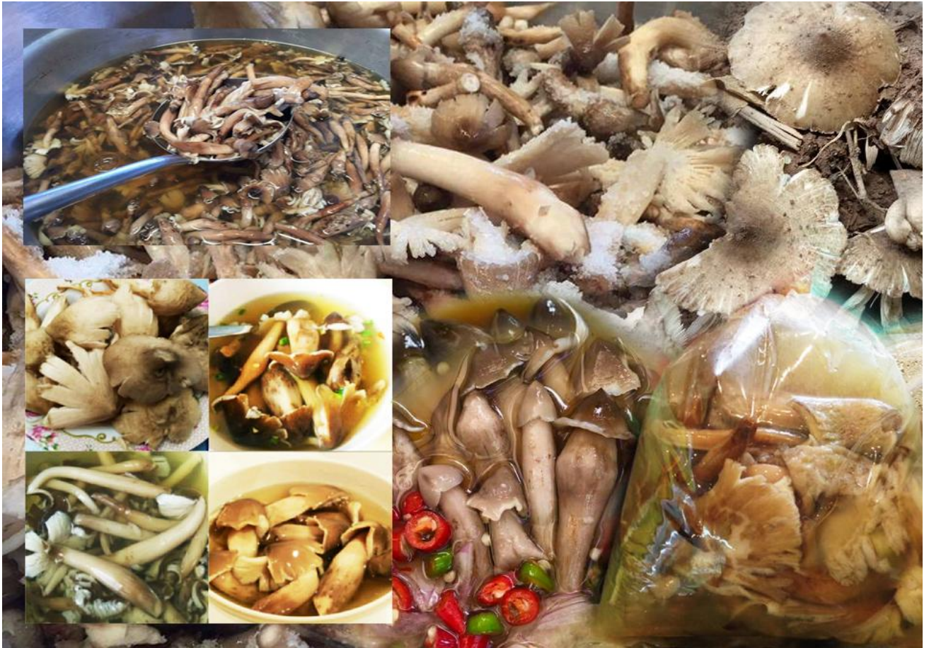
เห็ดโคน อำเภอบรรพตพิสัย