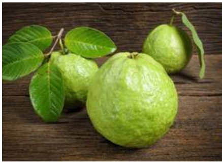
ฝรั่ง -> ขี้ปุ่น