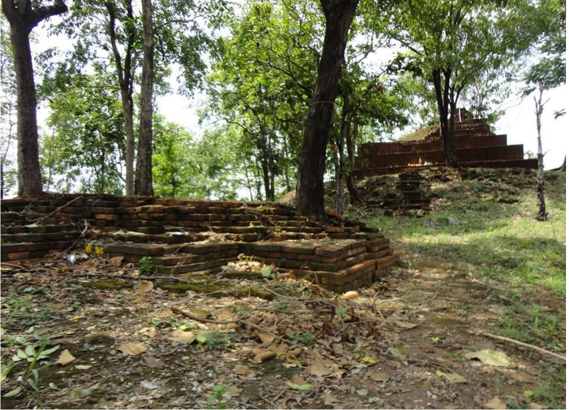
เขานางทอง ตำบลคีรีส อำเภอพราณกระต่าย