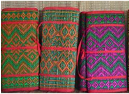
เสื่อ -> เสื่อ

อำเภอพรานกระต่ายมีเอกลักษณ์ที่สำคัญหลายประการเช่น