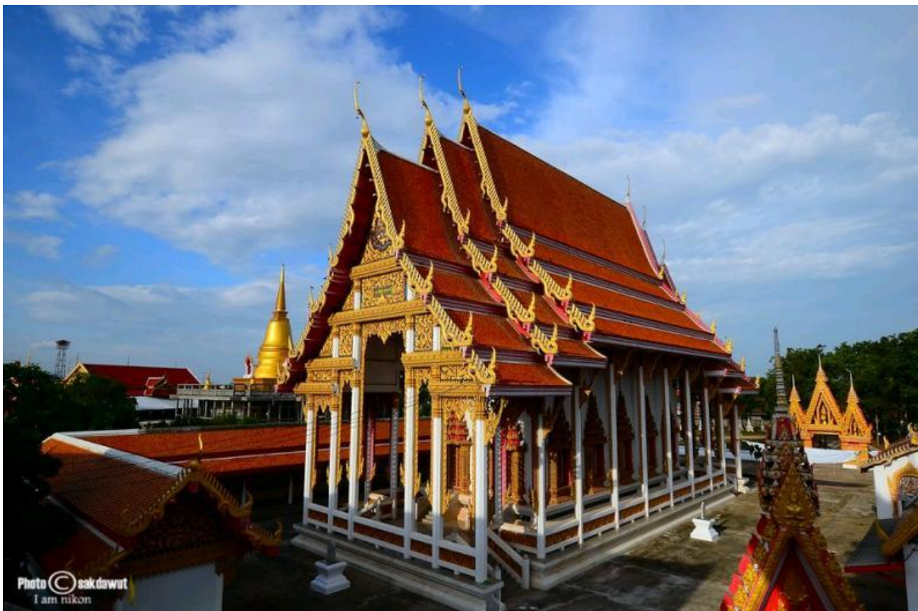
วัดกุฎีการาม ตำบลพรานกระต่าย

อำเภอพรานกระต่าย เป็นอำเภอที่เก่าแก่ และมีประชาชน ที่อยู่มากตั้งแต่สมัยโบราณ มีภาษา วัฒนธรรม และเอกลักษณ์ เป็นของตนเอง นับว่าเป็นอำเภอที่ทรงคุณค่าที่น่าศึกษาที่สุดอำเภอหนึ่งในจังหวัดกำแพงเพชร