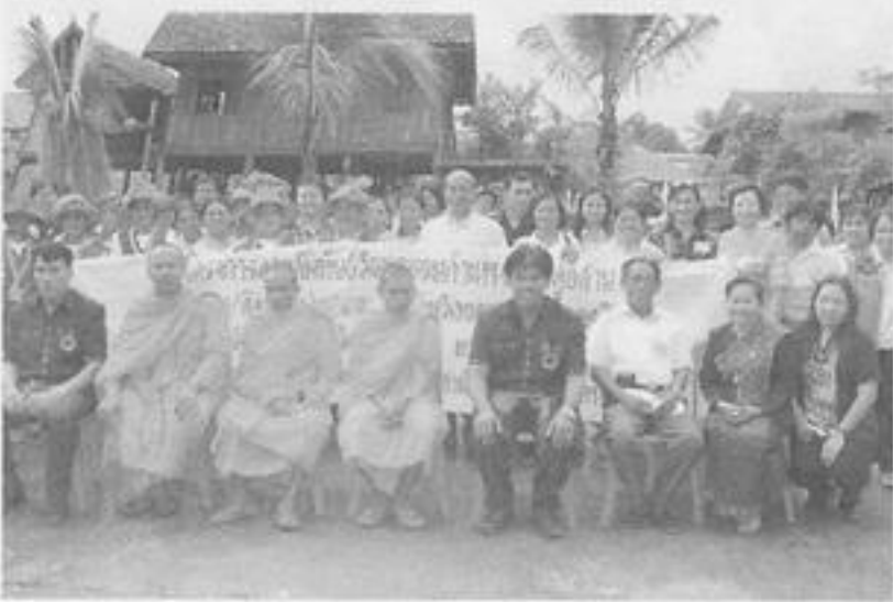
ศึกษาดูงาน ชมการแสดง ณ ศูนย์วัฒนธรรมไทยผู้ไทย และวัดพระพรต ต.บ้านโพธิ์ อ.คำม่วง จ. กาฬสินธุ์

วันที่ ๑๕ - ๑๗ สิงหาคม พ.ศ. ๒๕๕๙ จังหวัดขอนแก่น - กาฬสินธุ์ โดย สำนักงานวัฒนธรรมจังหวัดกำแพงเพชร เทศบาลตำบลสลกบาตร เทศบาลตำบลพลาญธรลักษ์บุรี , อบต.ระหาน , อบต.บึงสามัคคี จังหวัดกำแพงเพชร