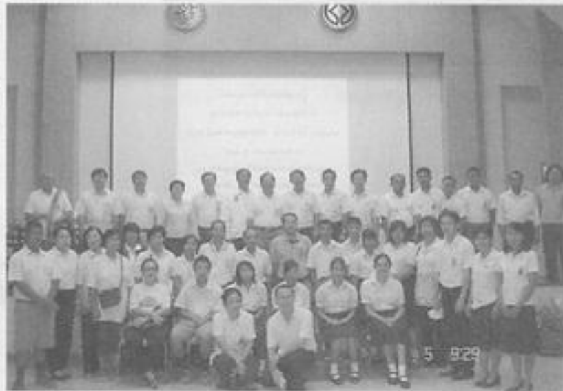
สวจ.กพ. จัดโครงการศึกษาเรียนรู้มรดกทางศิลปวัฒนธรรม จังหวัดกำแพงเพชร ประจำปี ๒๕๕๙ ณ อุทยานประวัติศาสตร์กำแพงเพชร วัดวังพระธาตุ / วัดปราสาท / วัดจันทาราม / วัดหงษ์ทอง