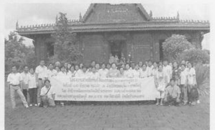
คณะศึกษาดูงานถ่ายภาพร่วมกัน บริเวณหน้าโบสถ์ไม้สัก อึ้งดงาม ณ วัดพุทธนิมิตภูค่าว อ. สหัสขันธ์ จ. กาฬสินธุ์