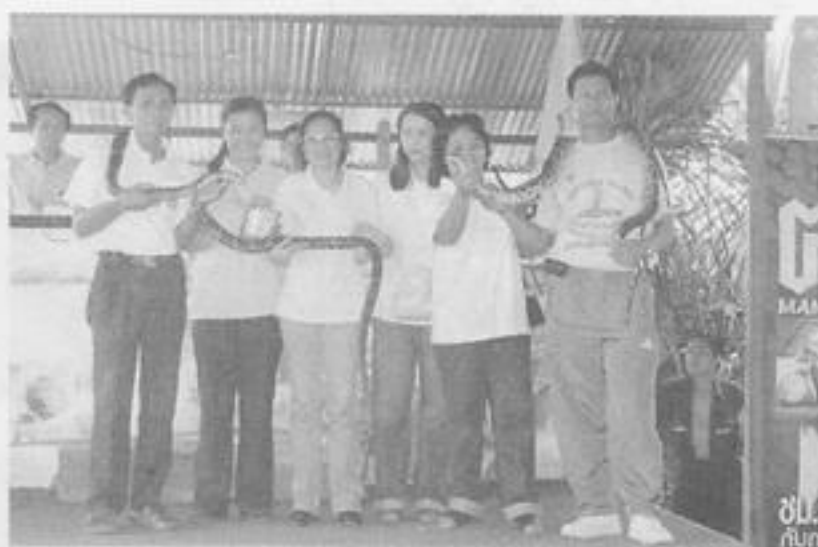
คณะศึกษาดูงานชมการแสดงคนกับงูจงอาง ณ หมู่บ้าน งูจงอาง อ.น้ำพอง จ. ขอนแก่น