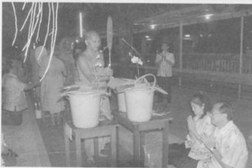
พระเทพปริยัติ เจ้าคณะจังหวัดกำแพงเพชร และเจ้าอาวาส วัดคูยางพิจารณาผ้าป่า