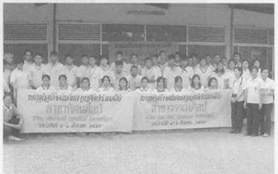
สวจ.กพ. ส่งเยาวชนเข้าร่วมโครงการค่ายเยาวชนสร้างสรรค์ ผลงานศิลปะร่วมสมัย ณ จ.พิจิตร