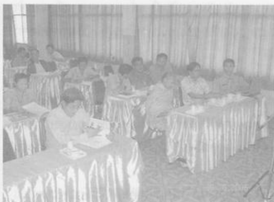
ผู้เข้าร่วมประชุมวิพากษ์โครงการเล่าเรื่องด้วยภาพ รับฟังการบรรยายจากวิทยากรอย่างสนใจ