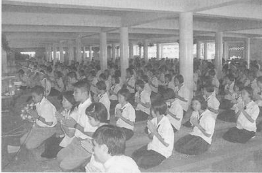
คณะนักเรียนขณะทำพิธี

๔. เมื่อมีบุคคลต่างศาสนาเกิดความเลื่อมใสในพระพุทธศาสนา ต้องการจะประกาศตน เป็นชาวพุทธ ก็ประกอบพิธีแสดงตนเป็นพุทธมามกะ เพื่อประกาศว่า นับแต่นี้ไปตนยอมรับนับถือ พระพุทธศาสนาแล้ว