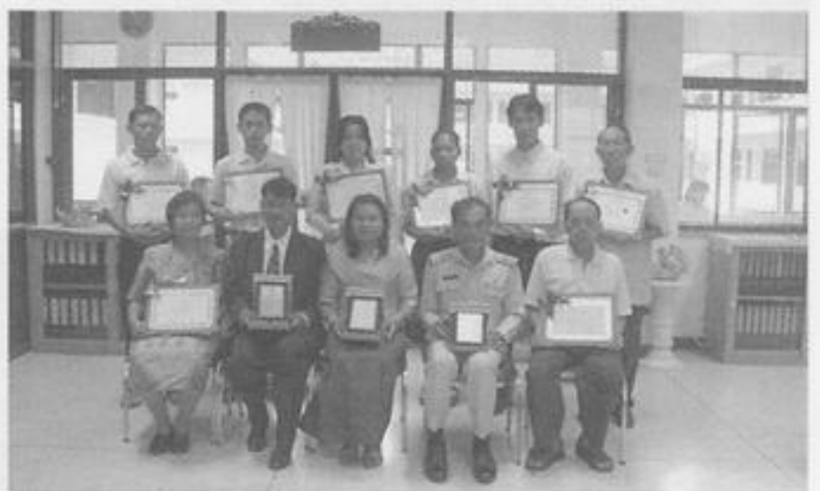
ผู้ที่ได้รับการคัดเลือกตามโครงการเมืองไทย เมืองคนดี ประจำปี ๒๕๕๙ รับมอบโล่และเกียรติบัตรจากนายไพศาล รัตนพิลลภ พวจ.กพ.