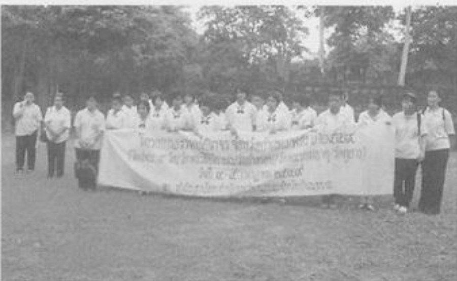
สวจ.กพ. จัดโครงการธรรมทัศนจาร จ.กำแพงเพชร ปี พ.ศ. ๒๕๕๙ ณ วัดพระสี่อริยาบถ / วัดช้างรอบ / วัดพระบรมธาตุ / วัดคูยาง