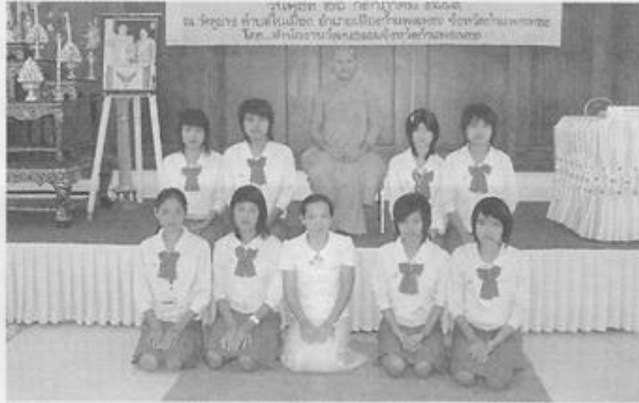
สวจ. กพ. จัดโครงการส่งเสริมการเรียนรู้ศาสนาพืธีสำหรับเด็กและเยาวชน จ. กพ. ณ วัดคูยาง อ.เมือง จ. กำแพงเพชร