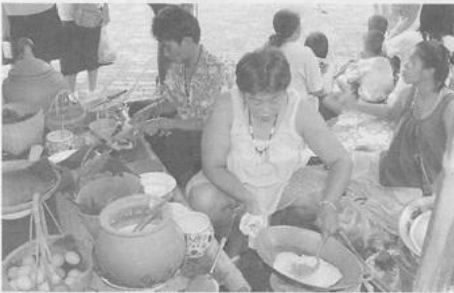
สวจ. กพ. จัดตลาดย้อนยุค ในงาน ๑๐๐ ปี เสด็จประพาสต้น พระพุทธเจ้าหลวง (รัชกาลที่ ๕) ในวันที่ ๒๐ - ๒๑ ส.ค. พ.ศ. ๒๕๕๙ ณ ลานอนุรักษวัฒนธรรม ริมฝั่ง อ. เมือง จ. กพ.