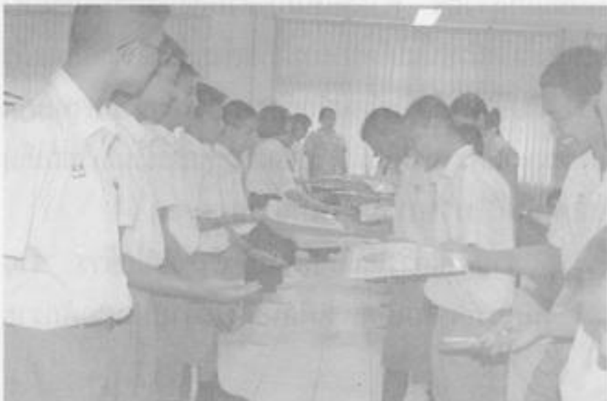
เยาวชนที่เข้าร่วมโครงการฯ ร่วมดำเนินกิจกรรมแบบมีส่วนร่วมตามโครงการฯ