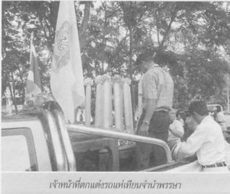
เจ้าหน้าที่ตกแต่งรถแห่เทียนจำนำพรรษา