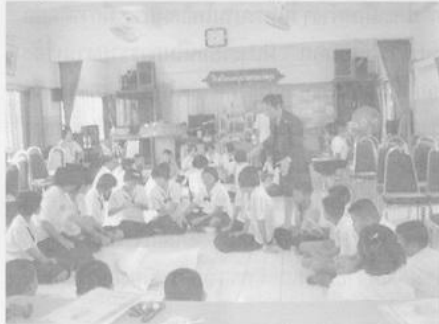
นักเรียนผู้เข้าร่วมโครงการฯ และร่วมดำเนินกิจกรรมแบบมีส่วนร่วม