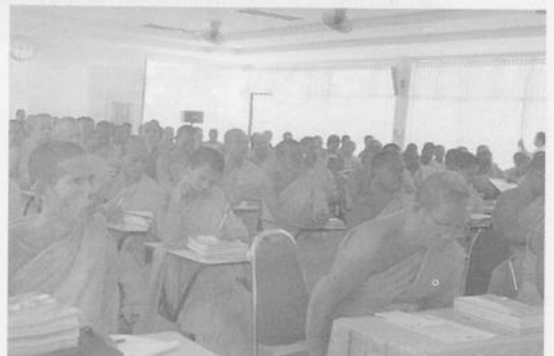
ครูพระสอนศีลธรรมในโรงเรียน จังหวัดกำแพงเพชร จำนวน ๑๓๖ รูป ขณะรับฟังการบรรยาย