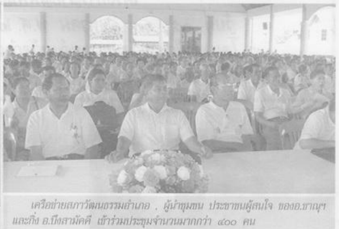
เครือข่ายสภาวัฒนธรรมอำเภอ , ผู้นำชุมชน ประชาชนผู้สนใจ ของอ.ขามเฒ่า และกิ่ง อ.บึงสามัคคี เข้าร่วมประชุมจำนวนมากกว่า ๔๐๐ คน