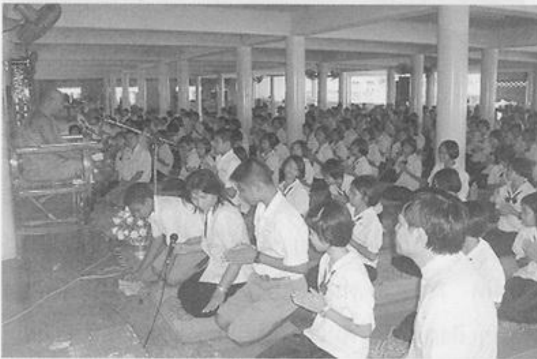
นักเรียนโรงเรียนพรานกระต่ายพิทยาคม ขณะทำพิธีพุทธมามกะ

เป็นที่ยอมรับกันว่าโลกในยุคปัจจุบันนี้มีความเจริญก้าวหน้าทางด้านวิทยาศาสตร์และเทคโนโลยีต่าง ๆ อยู่ในเกณฑ์ที่สูงมากอีกทั้งยังรวดเร็ว ว่องไวอย่างไร้พรมแดนสร้างความเปลี่ยนแปลงให้กับสังคมอย่างที่ไม่เคยมีมาก่อน ความเปลี่ยนแปลงเหล่านั้นทำให้มนุษย์มีความเป็นอยู่ที่ดีขึ้น มีความสะดวกสบาย ทันสมัย แต่ขณะเดียวกันก็สร้างปัญหาให้กับสังคมในหลาย ๆ ด้าน โดยเฉพาะด้านวัฒนธรรมการดำเนินชีวิตในหมู่นักเรียนนักศึกษาหลายคนปรับตัวให้เข้ากับยุคโลกาภิวัตน์ไม่ได้ ประพฤติปฏิบัติตนผิดวัฒนธรรม ประเพณีที่ดีงาม เป็นเรื่องที่หลาย ๆ ฝ่ายต้องหาทางแก้ไข วิธีหนึ่งที่น่ามาใช้ก็คือการนำเอาศาสนา มาเป็นที่พึ่งทางใจ ยึดกรอบระเบียบของศีลธรรมเป็นแนวทางในการดำเนินชีวิต ในทางศาสนาพุทธ การแสดงตนเป็นพุทธมามกะ ก็เป็นกิจกรรมหนึ่งที่นิยมทำกันมากในสถานศึกษาทั่วไป โดยเฉพาะในจังหวัดกำแพงเพชร