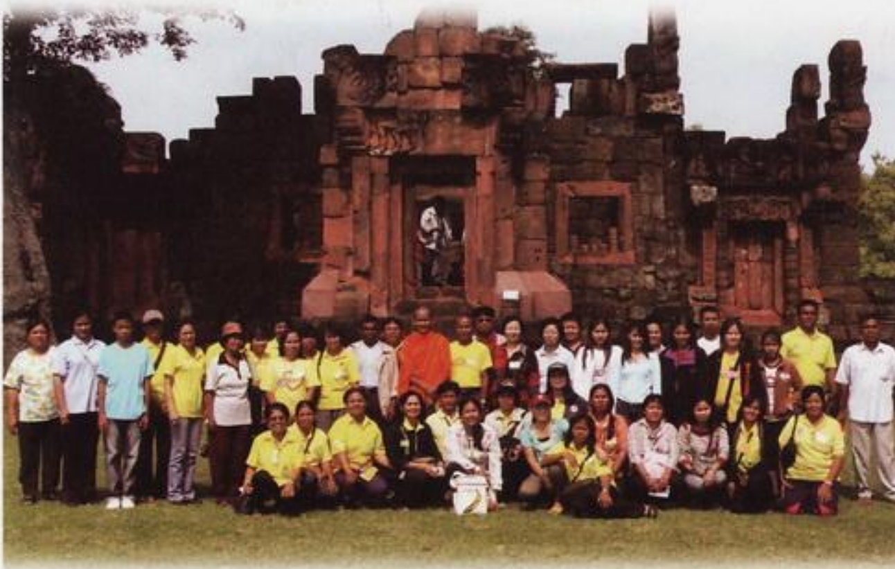
สวจ. กำแพงเพชร จัดโครงการสายสัมพันธ์กำแพงเพชรสู่อีสาน วันที่ ๑๕ - ๑๗ สิงหาคม พ.ศ. ๒๕๔๙ ณ จังหวัดขอนแก่น - กาฬสินธุ์