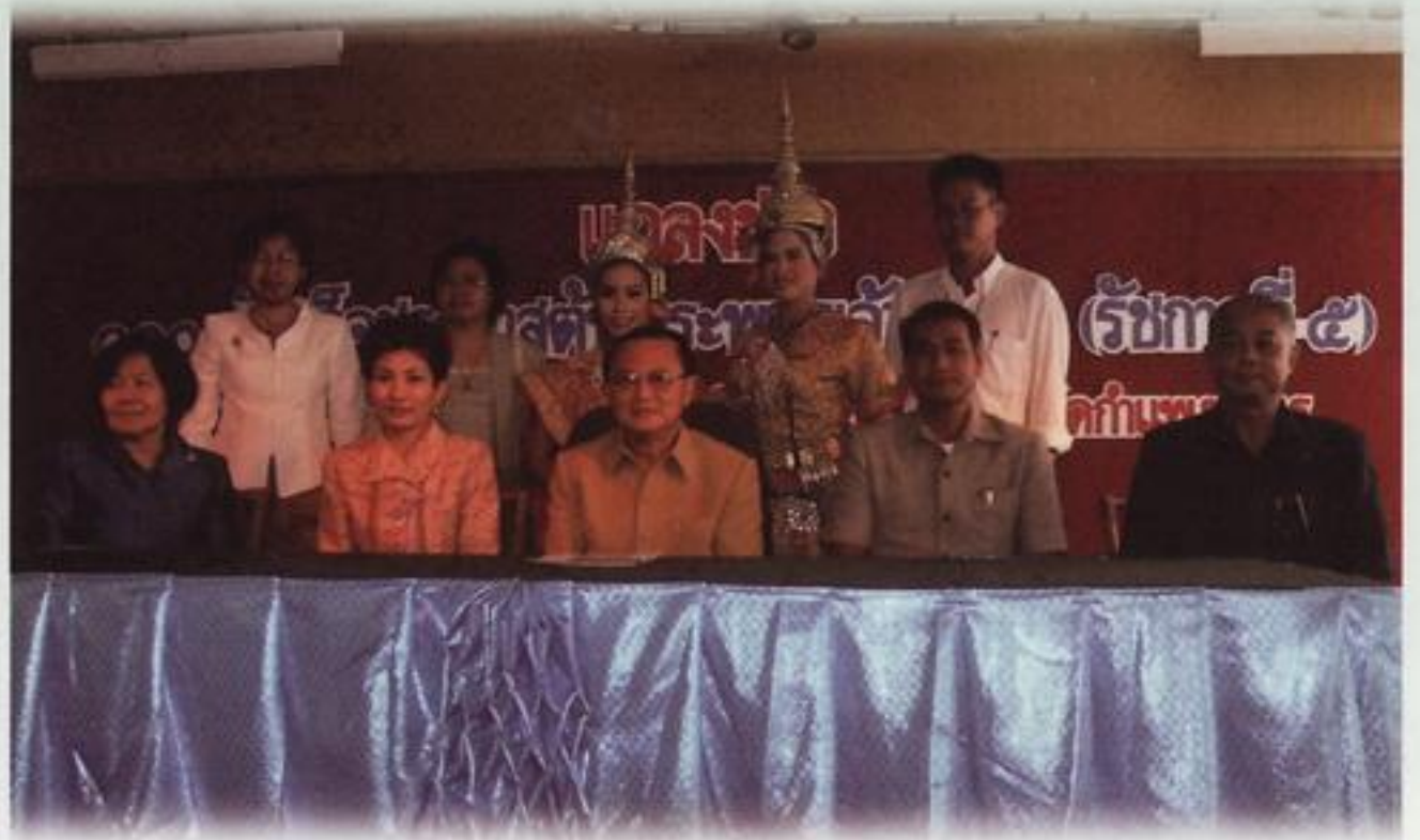
จังหวัดกำแพงเพชร จัดงาน ๑๐๐ ปี เสด็จประพาสต้น พระพุทธเจ้าหลวง (รัชกาลที่ ๕) ในวันที่ ๑๘ - ๒๗ ส.ค. พ.ศ. ๒๕๔๙ โดยจัดแสดงขบวน โรงแรมนวรรัตน์ อ. เมือง จ. กำแพงเพชร โดย สวจ.กพ. รับผิดชอบกิจกรรม ตลาดย้อนยุค