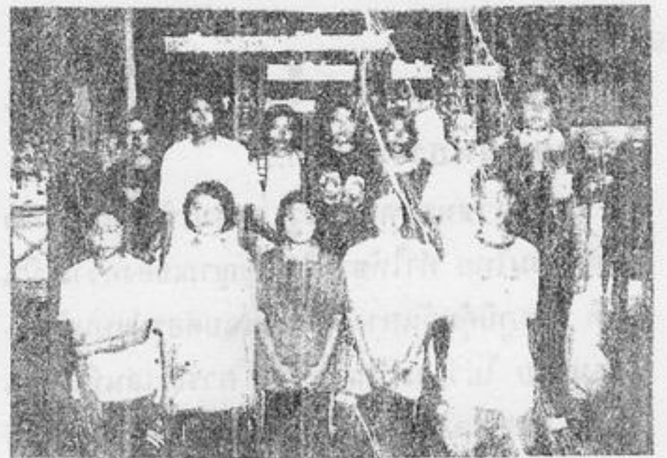
นักเรียนเข้าอบรมโครงการรณรงค์อนุรักษ์แหล่งศิลปกรรมฯ

รณาในสังคมไทย ยุคนี้เป็นอย่างยิ่ง และปรากฏว่าได้รับการขานรับจากวิญญูชนทั้งหลาย นำนักศึกษา ระดับปริญญาโท ปริญญาเอก มีครูอาจารย์จากสถาบันต่าง ๆ ตลอดจนสื่อมวลชนเข้ามาศึกษาดูงาน และ ร่วมเผยแพร่ผล งานอย่างมากมาย