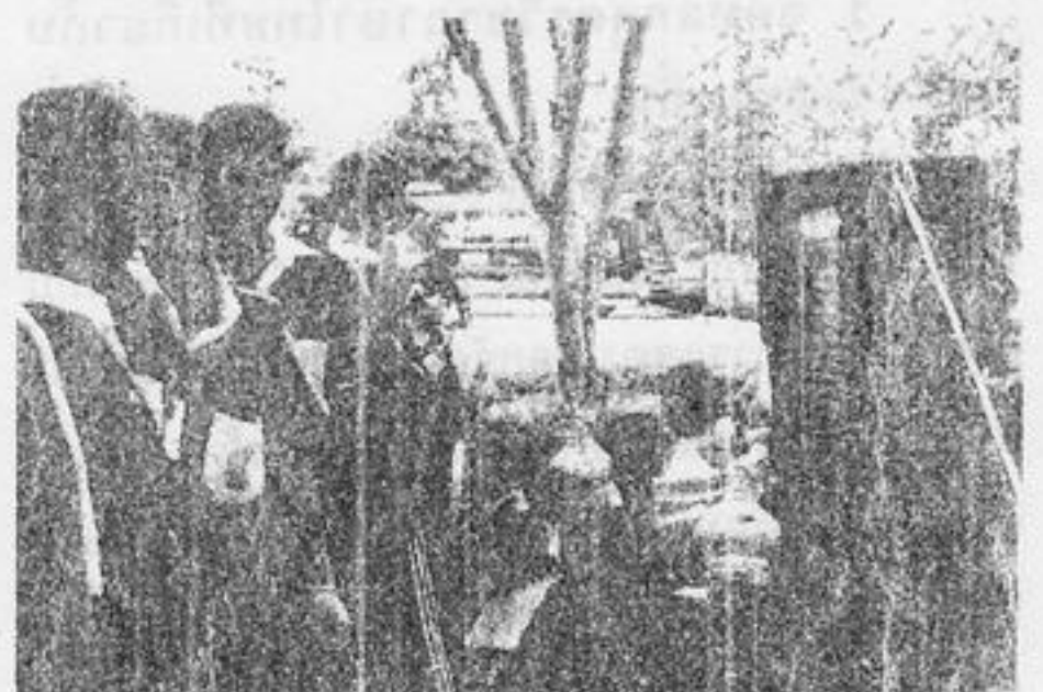
นักเรียนทัศนศึกษา แหล่งศิลปกรรมกำแพงเพชร

และหน้าที่สำคัญนี้เป็นของทุกคนมิใช่หรือ ?